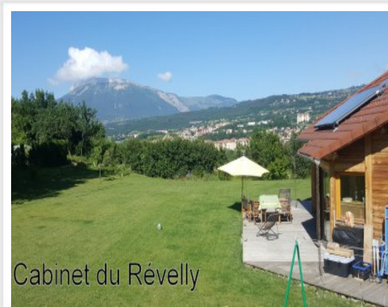
Cabinet du Révelly

(570 000 € hors honoraires) soit 2,6% TTC